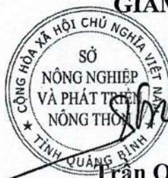
Trần Quốc Tuấn